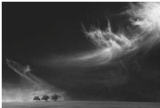
Thomas Finkler - 3 Bäume, dramatischer Wolkenhimmel 05

Seit 1995 hat sie Einzelausstellungen und Ausstellungsbeteiligungen unter anderem in Regensburg, Ensdorf, Weiden und Cheb (Tschechische Republik).